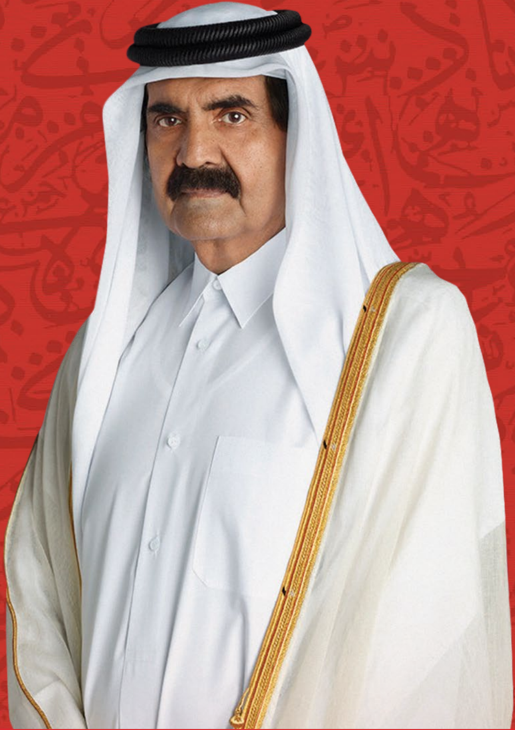
حضرة صاحب السمو الشيخ حمد بن خليفة آل ثاني الأمير الوالد