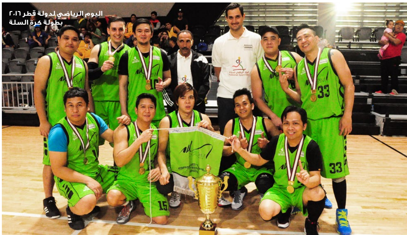
اليوم الرياضي لدولة قطر ٢٠١٦ بطولة كرة السلة