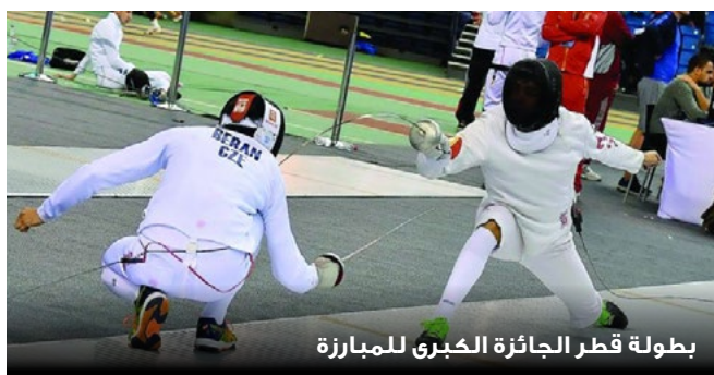
بطولة قطر الجائزة الكبرى للمبارزة