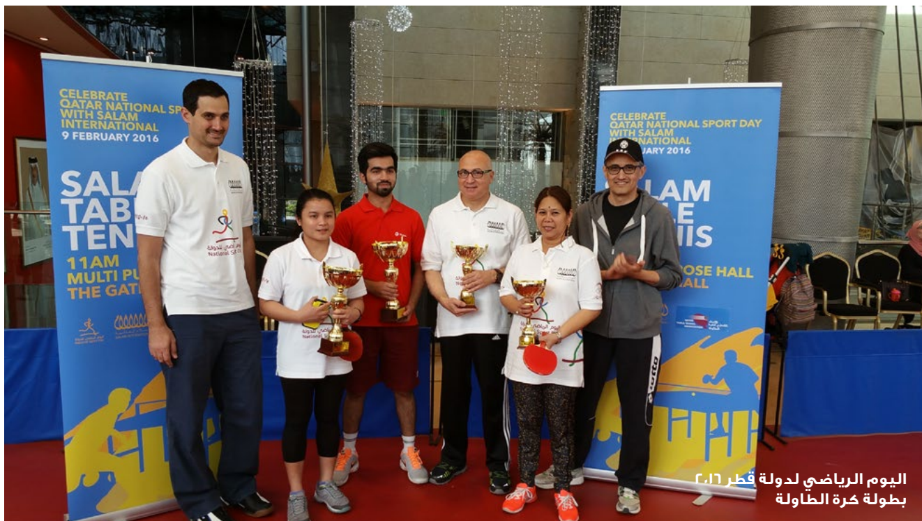
اليوم الرياضي لدولة قطر ٢٠١٦ بطولة كرة الطاولة