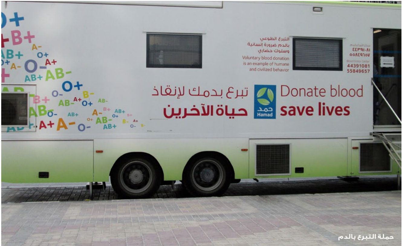
حملة التبرع بالدم