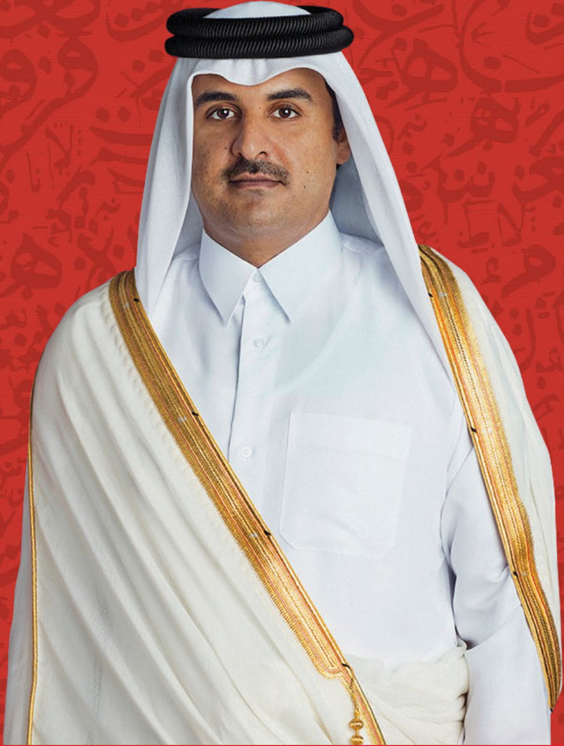
حضرة صاحب السمو الشيخ تميم بن حمد آل ثاني أمير دولة قطر المفدى